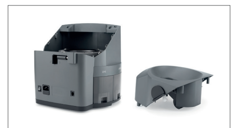
Capot supérieur amovible pour faciliter le nettoyage