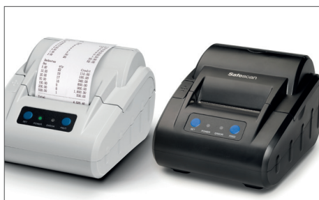
Imprimante thermique Safescan TP-230 Article : 134-0475 gris Article : 134-0535 noir