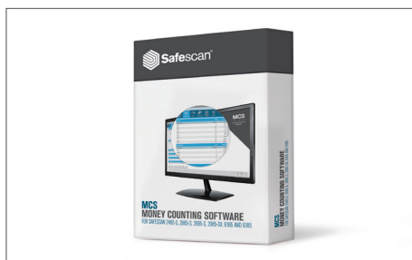
Logiciel Safescan MCS Article : 124-0500