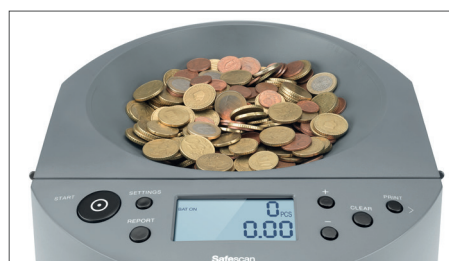
Capacité de la trémie de 1.000 pièces maximum