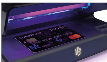
Vérifie les caractéristiques UV des cartes de crédit